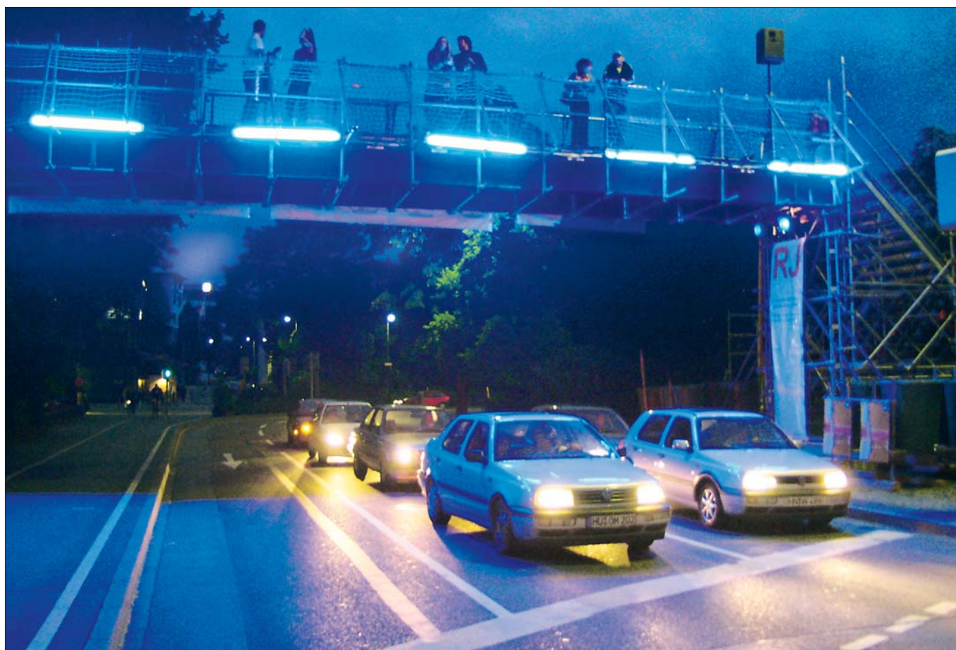
Die Autofahrer sehen blau ...

Trotz, als Ort der Besinnung und Erholung. Ein Japanischer Garten wurde während dieser Tage jedenfalls nicht vermisst. tno