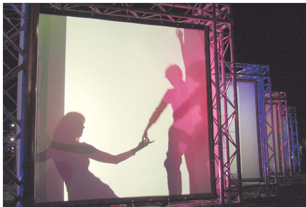
Tanz urban, Choreographie Jai Gonzales